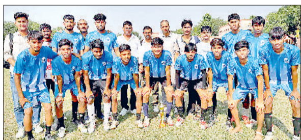
महेंद्रगढ़। ट्रॉफी के साथ विजेता टीम।