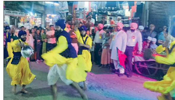
रेवाड़ी। नगर-कीर्तन की अगुवाई करते पंज प्यारे व नगर-कीर्तन में करतब दिखाते हुए गतका पार्टी।