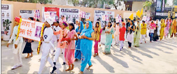
महेंद्रगढ़। रैली निकालते विद्यार्थी।