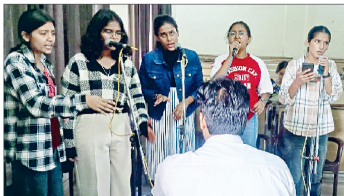
रेवाड़ी। केएलपी कॉलेज में गुप डांस की रिहर्सल करती छात्राएं व युवा महोत्सव के लिए नाटक का रिहर्सल करती छात्राएं व गुप सांग का रिहर्सल करते हुए छात्राएं।