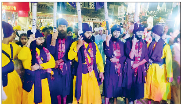
रेवाड़ी। नगर-कीर्तन की अगुवाई करते पंज प्यारे व नगर-कीर्तन में करतब दिखाते हुए गतका पार्टी।