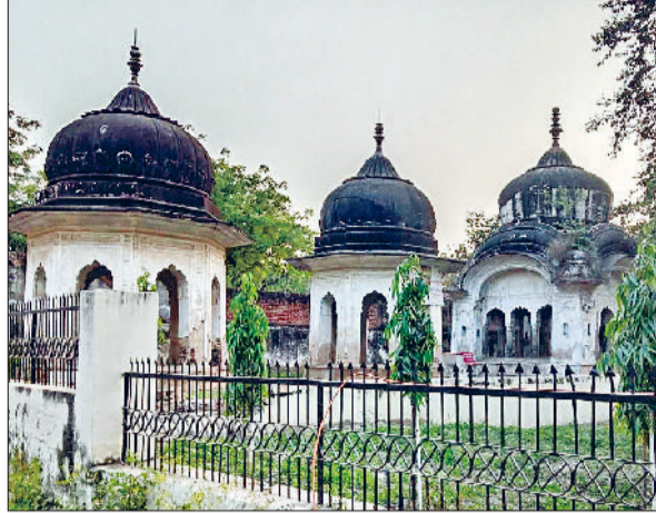
दिल्ली रोड पर स्थित ऐतिहासिक छतरियां